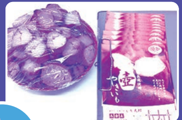
壺やきいも専門店 くり太郎 様