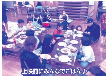
上映前にみんなでごはん♪