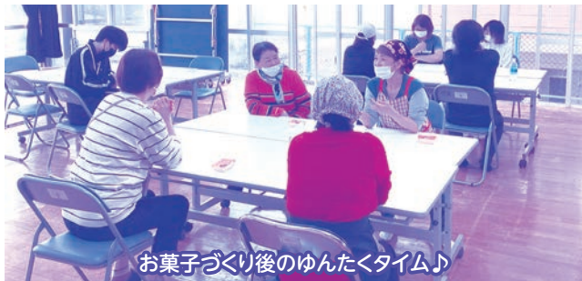
お菓子づくり後のゆんたくタイム♪

今回は南風原社協に実習で来ていた2人の学生も一緒に参加し「週末に、公民館で住民主体のこういった楽しい地域活動を行われている事が、大切な地域づくりに繋がっている事に改めて気づき、実際に参加してみても楽しかった!」と話してくれました。