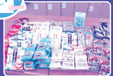
ダイワコーポレーション 様