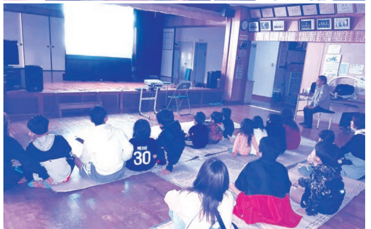
映画「マイ・エレメント」鑑賞