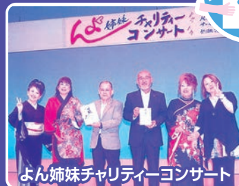
よん姉妹チャリティーコンサート