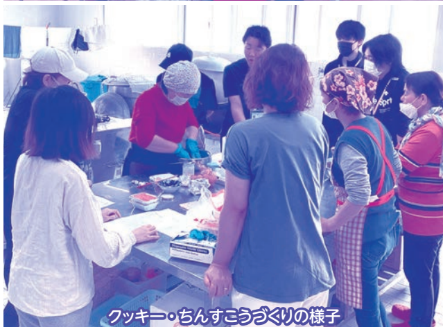
クッキー・ちんすこうづくりの様子