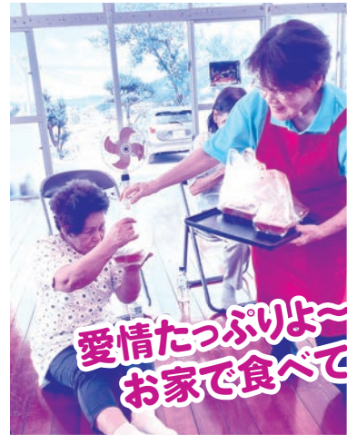
愛情たっぷりよ～ お家で食べてね～

高齢社会を迎えた今、「住み慣れた地域で元気に暮らし続ける」ためには、地域における住民同士の支え合い活動や、地域の中でつながりや役割を持つこと、楽しく過ごせる居場所があることはとても大切です。南風原町では住民同士の支え合い活動や地域のつながり作りをしている地域があります。 ここでは、通いの場をはじめとする各地域の活動を紹介していきます。