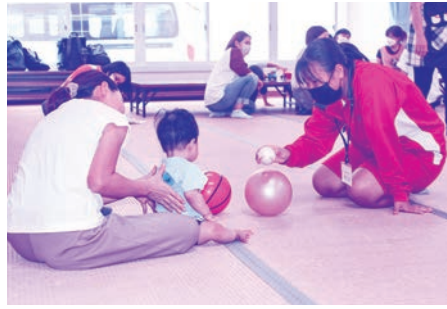
ボール遊びで仲良しに!