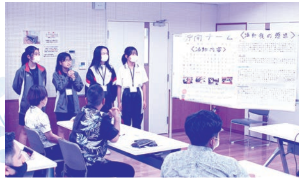
冲南チーム 活動体験報告