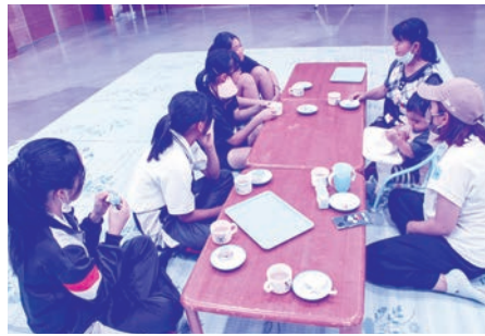
ボランティアさん手づくりのおやつで ティータイム