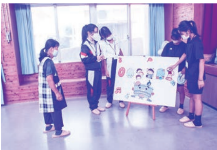
パネルシアターの練習をする様子