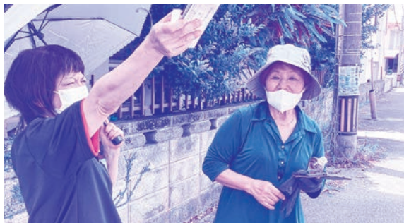
あっちだねー スマホで確認しながら探します