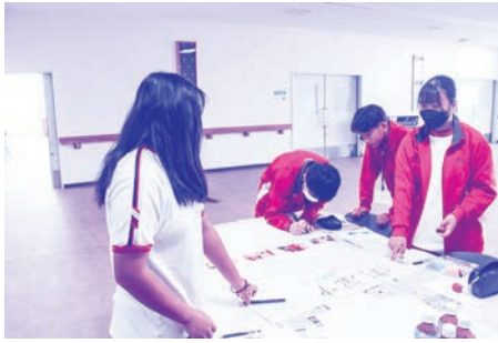
チームで報告書作成