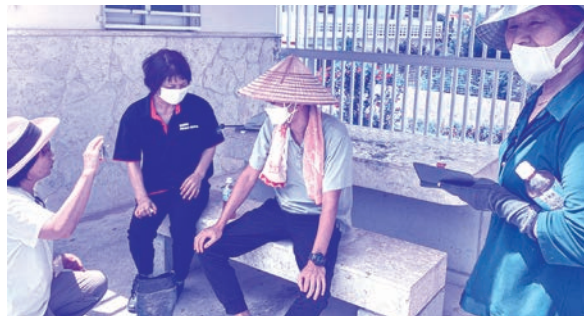
無事発見することが出来ました

の学びの機会の確保を予定しています。皆さんと一緒に地域の支え合い、助け合いによる安心のまちづくりを進めていきたいと思えます。