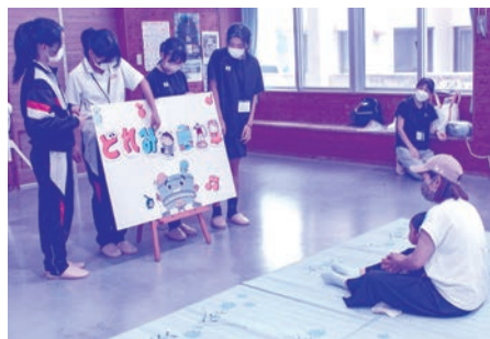
みんなで協力してパネルシアターを披露