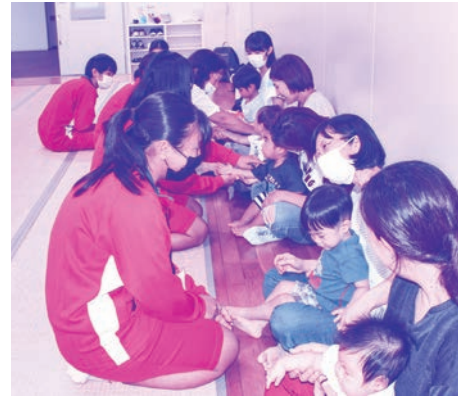
お兄ちゃんお姉ちゃんとのふれあいに 子どもたちもうれしそう