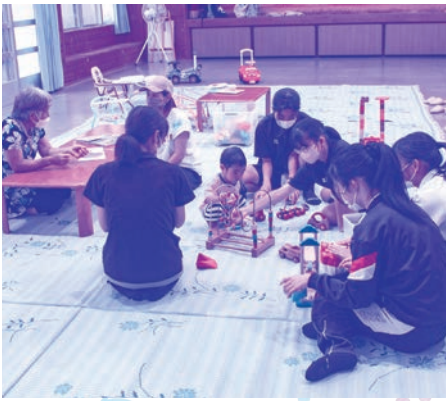
おもちゃ遊びで 徐々に打ち解けてきました