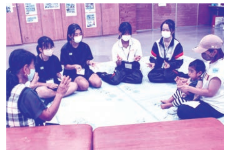
みんなで手遊びをしている様子