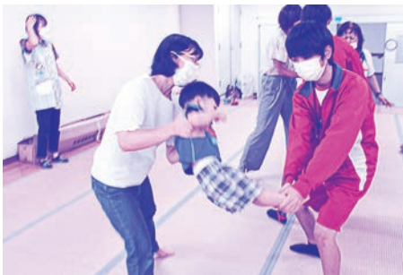
学生も手伝ってふれあい遊び(ブランコ)

コロナ前は今よりも参加者が多くて 5・6歳の子も参加していました。 バスに乗って動物園にも行きました。