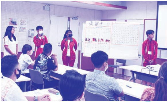
南星中チーム 活動体験報告