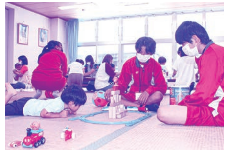
電車のおもちゃに興味津々