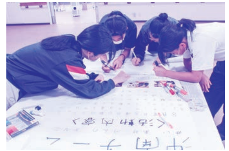
チームで報告書作成