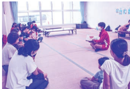
学生による絵本の読み聞かせ