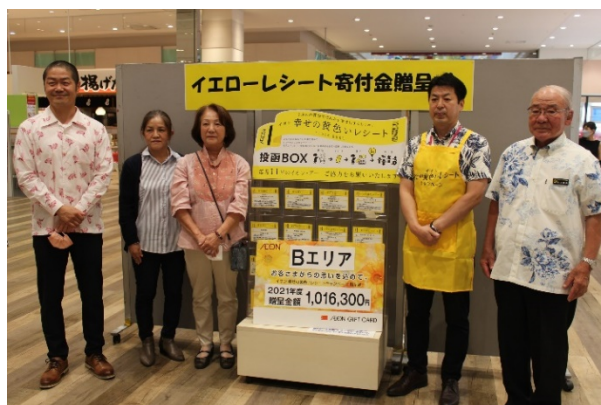
「幸せの黄色いレシートキャンペーン」贈呈式