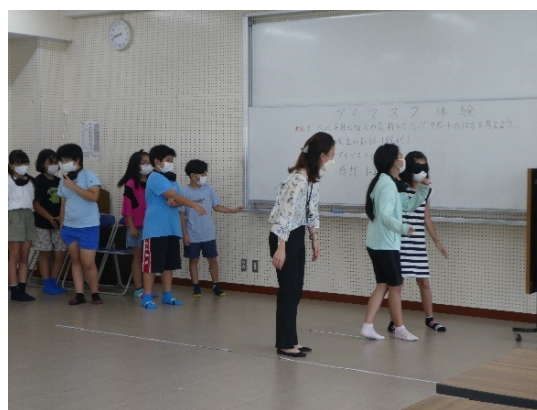
(北丘小学校 福祉講話及びアイマスク体験)