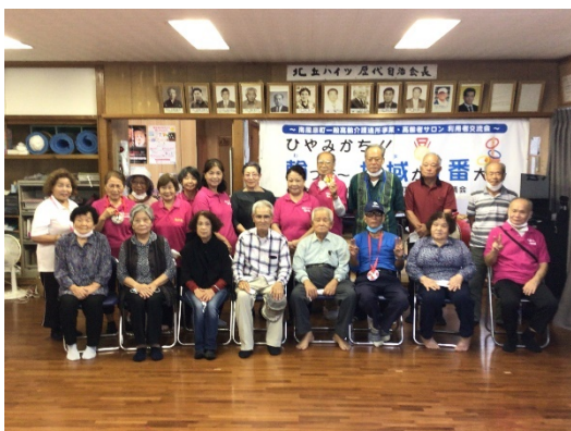
(北丘ハイツ階の会：優勝)