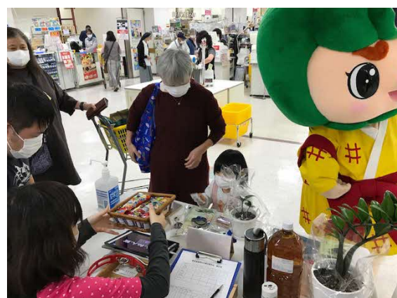
(丸大スーパーでの様子)