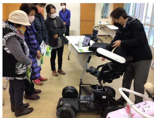
(最新の電動車イスの使い方)