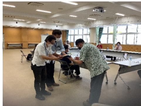
（企業へ協定証の交付）