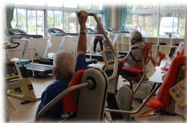
☆ 高齢者健康づくり推進事業

* 福祉団体への支援 * 障がい者居場所づくり支援事業 等 1,519,000円