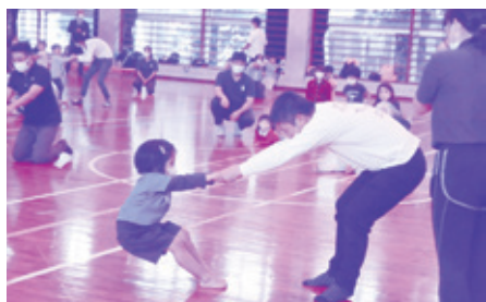
子育て講演会(親子体操)