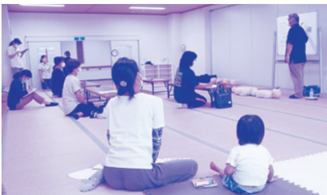
子育てサロンの親子も一緒に受講しました