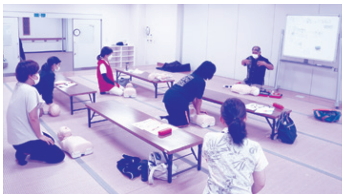
真剣に受講する参加者