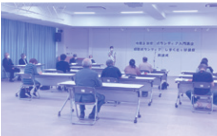
ボランティア入門講座(島くとっば)