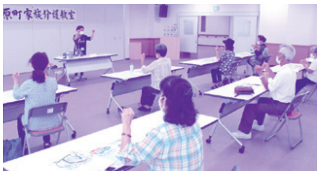
イチ、二、サン…講師のかけ声に合わせて脳トレ指体操