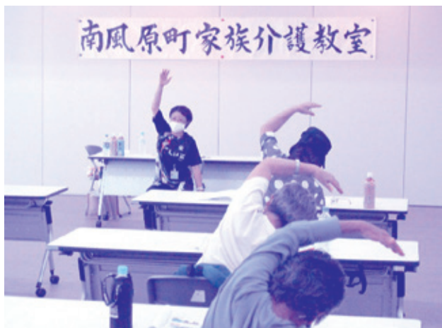
座ったままでもできるストレッチは、日常生活に取り入れやすいね～