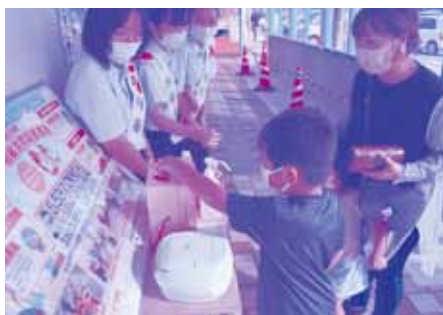
店頭募金(サンエー)