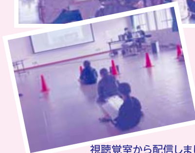
視聴覚室から配信しました