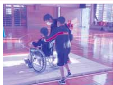
マットを利用して段差の練習