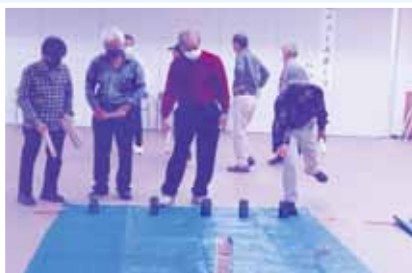
スウェーデン生まれのスポーツKUBB(クubb)

初めてのニュースポーツ体験に参加した方々は、戸惑いながらも楽しそうにしていました。ニュースポーツの特徴のひとつとなっている「仲間づくり」が表れているように感じました。