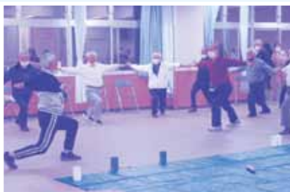
しっかりストレッチ!