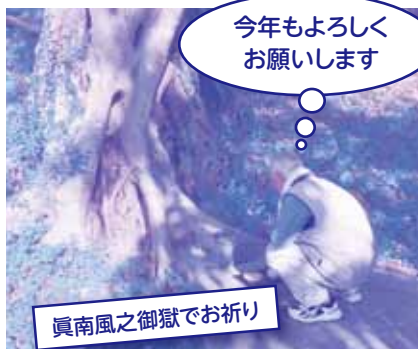
眞南風之御嶽でお祈り