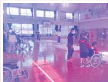
順番よく全身体験しました

また、令和4年1月12日(水)には北丘小学校4年生を対象とした社協職員による福祉講話「①福祉とは②ユニバーサルデザインとは」を行いました。視聴覚室と教室をオンラインでつないでの講話となりましたが、離れていてもつながることができ、工夫次第ではいろいろなことができるのではと感じたと同時に、やはり対面での児童たちとのやり取りも楽しみたいなと感じました。