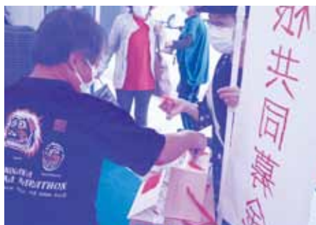
店頭募金(かねひで)