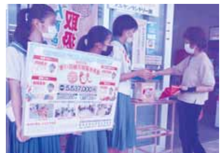
店頭募金(サンエー)