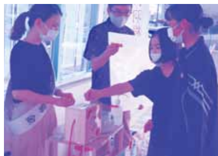
店頭募金(サンエー)