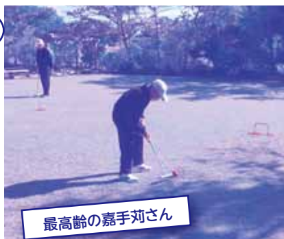
最高齢の嘉手苺さん