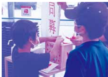
店頭募金(かねひで)