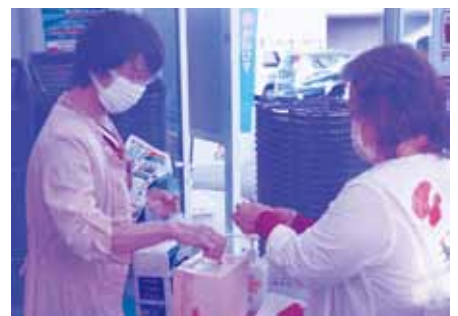
店頭募金(かねひで)