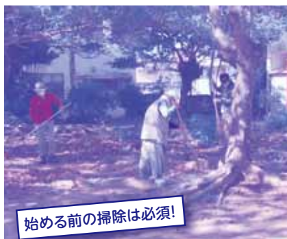
始める前の掃除は必須!

兼城ゲートボール部会では、最高齢で94歳にもなる方をはじめ、幅広い年齢の方が集まり、大会に向けてみんなで試行錯誤しながらゲームを楽しんでいました。最後には、“今年は優勝を目指して頑張っていきましょう”という意気込みを聞くことができました。これからの兼城ゲートボール部会の活躍を楽しみにしています♪