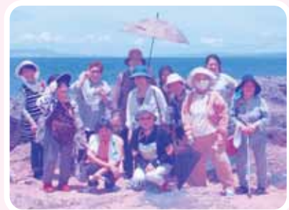
ピクニック(令和2年)

お問い合わせ:南風原町在宅介護支援センター(町社協内) TEL.(098)889-3502(担当:大城、大湾)