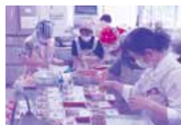
手際よくお弁当を詰めていきます

山川あみの会では、月2回、ミニデイ・高齢者サロンの日にボランティアさんによる食事づくりを行っています。現在は新型コロナウイルス感染症拡大の状況下ですが、中でも弁当を作り、見守り訪問を行っています。今回のオープンレンジの購入で食事づくりの時間も効率よく調理でき、さらに活気が湧いています。今後も高齢者の健康増進に寄与していきたいと思えます。