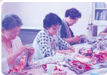
ティッシュカバー作り(令和元年の様子)