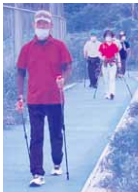
主に黄金森公園で活動しています