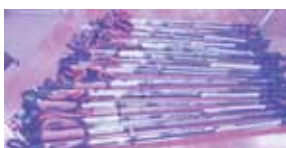
ポールを12セット購入しました

南風原町老人クラブ連合会では、今年度よりノルディックウォーキングの愛好者を募り活動を開始していますが、初めて参加を希望される方へ貸出し用のポールが無く、近隣市町村より借用しておりました。これからも高齢者の健康増進、介護予防にノルディックウォーキングを継続していきたいと思えます。