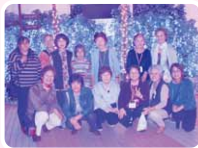
宿泊研修会(令和元年の様子)