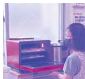
いただいたレンジもフル活用!!