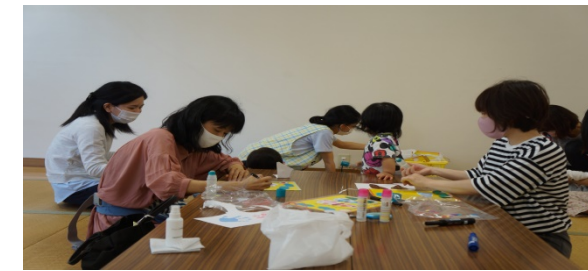
たんぼぼ広場出前保育 足形・手形でこいのぼり製作を楽しみました(^_^)