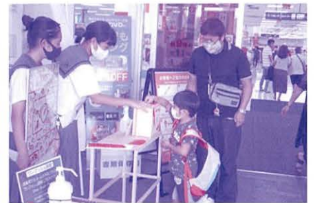
店頭募金 (サンエーつかざんシティー)