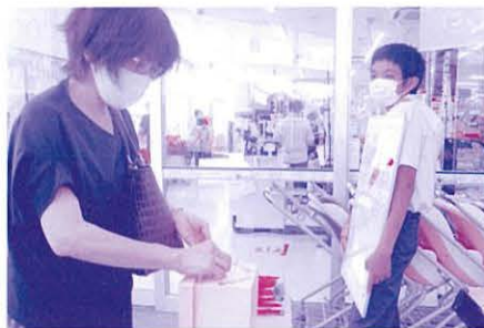
店頭募金 (かねひで 南風原市場)