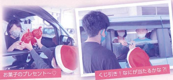
お菓子のプレゼント～♡