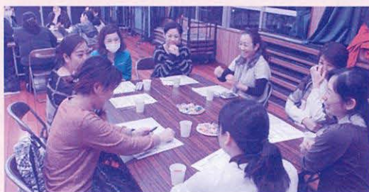
公民館で子どもたちがたくさん集まったらいいな～

懇談会では「喜屋武地区は地域行事が多いので、多くの人と顔見知りになれた。おかげで子どもたちは地域で見守ってもらっていて充実している」「子どもたちの長期休み(夏・冬・春休み)の時に公民館で食事ができたらいいな。勉強とか遊びも教えてくれるといいな」「喜屋武のおば一達で作るお惣菜屋さんがあるといいな。仕事が終わる4~5時頃まで購入できたらいいな」などの意見が聞かれました。