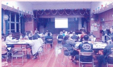
グループワークで健康づくりについて考えよう!

後半では「健康づくりについて、自分で喜屋武地区でやってみたいこと」をテーマにグループワークをしました。「朝、今より少し早起きして一品多く栄養価のある食品を作りたい」「地域で定期的みんなと一緒にウォーキングやラジオ体操をしたい」などの声があり、健康のことを考えるよいきっかけになったようでした。また「定期的に開催してほしい」「もっと多くの住民にPRしたい」との感想もあり、社協としても地域づくりを考える貴重な時間となりました。