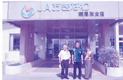
JA おきなわ 南風原支店 様