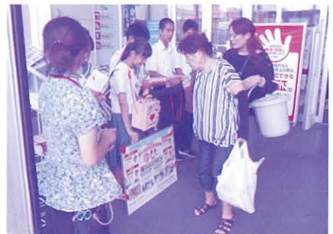
店頭募金(イオン南風原店)