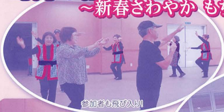
参加者も飛び入り!