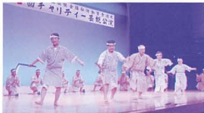
第32回チャリティー芸能公演

今年もたくさんの演目を準備していますので、多くの皆様のご来場をお待ちしています。