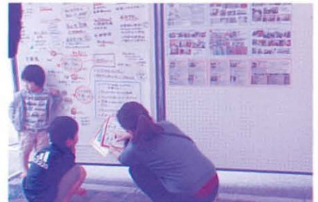
社協ブースでは災害ボランティアセンターの仕組みや防災の心得についてのパネル展示や100円ショップでそろった防災グッズ展示、兼城児童館の防災・防犯安全マップの取り組みなど展示しました