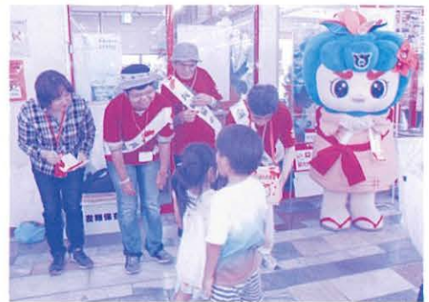
店頭募金(マックスバリュートー日橋店)