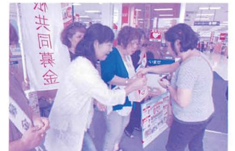
店頭募金(サンエーつかざんシティ店)