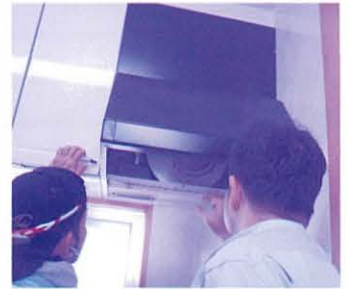
換気扇の点検、掃除を行っている様子