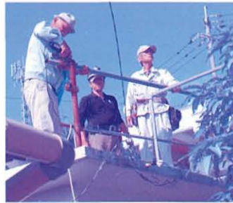
さびでくずれかけたビニールハウスの鉄骨みを取り除いている様子