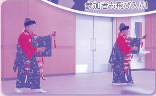
がんじゅう宅急便による余興