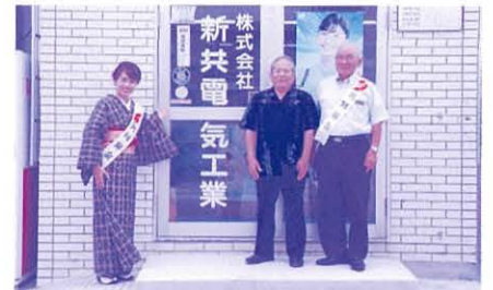
有限会社 新共電気工業 様