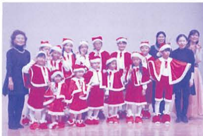
チャリティクリスマスコンサート