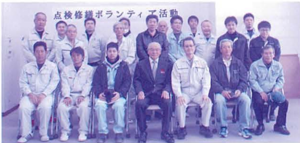
南風原電水会の皆さん