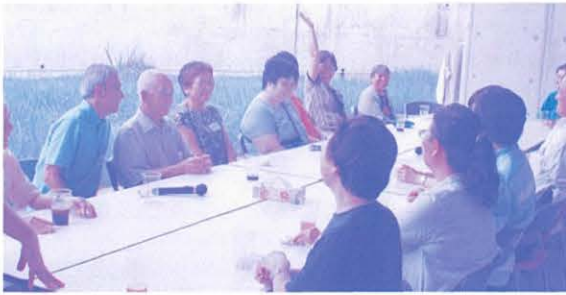
記憶力ゲームで皆、悪戦苦闘!