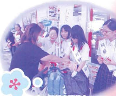
赤い羽根店頭募金 (マックスバリュー 一日橋店)