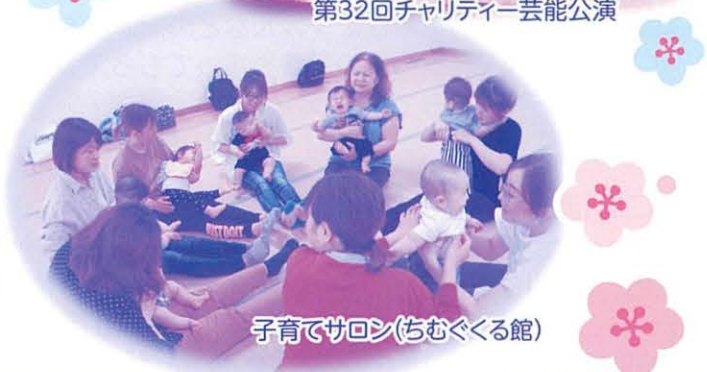
子育てサロン(ちむぐくる館)