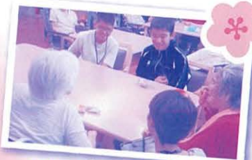
10代のボランティア研修会