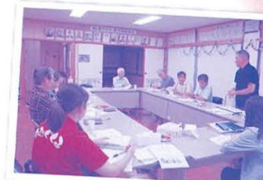
地域づくり推進委員会 (北丘ハイツ)