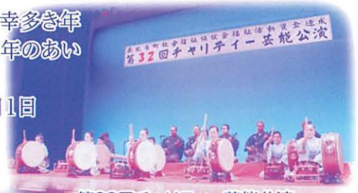
第32回チャリティー芸能公演