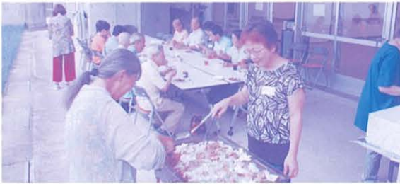
バーベキューでみんなお腹いっぱい

10月27日(日) 爽やかな秋空の下、ちむぐくる館の中庭で音訳サークルたんぽぽとCD利用者の皆さんとの年に1回の交流会がありました。