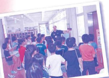
福祉学習の出前講座 (ユニバーサルデザイン探し)