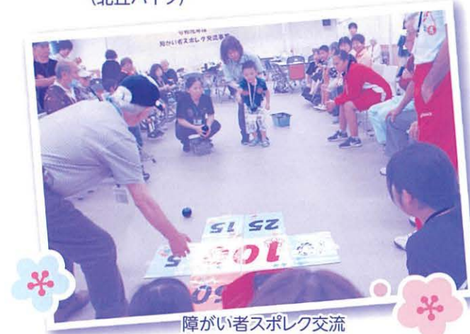
障がい者スポレク交流