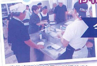
家族介護教室(男の料理教室)