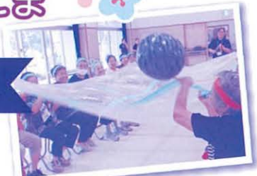
高齢者ミニデイ(津嘉山地区)

結びに、皆様にとりまして、この一年が幸多き年となりますよう心からお祈り申し上げ、新年のあいさつといたします。