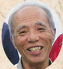
島袋 宗一 (大名)