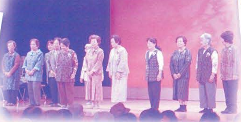
手づくり衣装でかすりのファッションショー(本部)