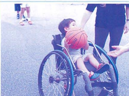
高齢者疑似・アイマスク・車いす・点字・音訳体験コーナー スポーツ用車いすなど様々な体験を通して高齢者や障がい者への理解を深める