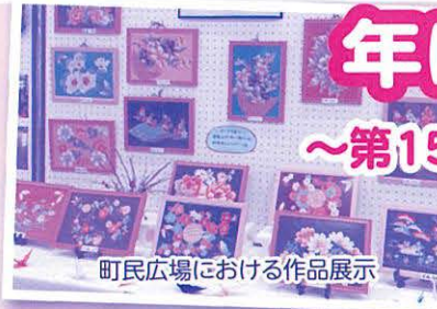
町民広場における作品展示