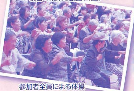
参加者全員による体操