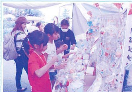
児童館まつり 就労体験型の遊び「キッズタウンはえるん」を開催!他にもゲームコーナーも大人気