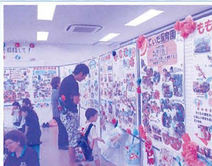
保育コーナー 各保育園の活動の紹介 手作りおもちゃコーナーが人気