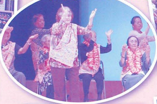
息ぴったりの踊りを披露(与那覇)