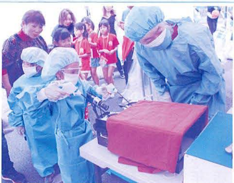
心と体の健康を楽しく考えるコーナー 医療機器体験、幻聴体験や最新の福祉用具の体験を通して心と体の健康への関心を高める