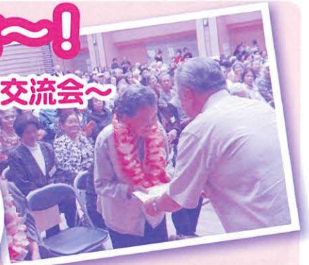
町長からご長寿者賞を授与される参加者