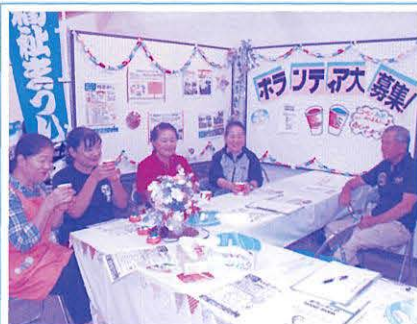
ボランティアカフェ(なかゆくい) 町内のボランティア活動をコーヒーを飲みながら紹介