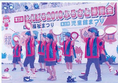
福祉施設団体・児童館舞台発表 町内福祉施設・団体・児童館サークルが日頃の活動の成果を元気に披露!

福祉まつり・児童館まつりは、子どもから高齢者まで幅広くふれあうことにより社会福祉に対する理解を深めていただくことを目的に開催されており、車いすや高齢者疑似体験、医療機器体験、遊びの中での就労体験など様々なコーナーが有り、多くの方々に足を運んでもらい福祉を考えるよい機会となりました。