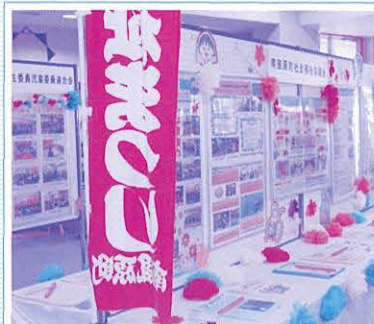
社会福祉展示コーナー 町内の社会福祉団体や保健福祉施設の活動を紹介