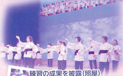
練習の成果を披露(照屋)