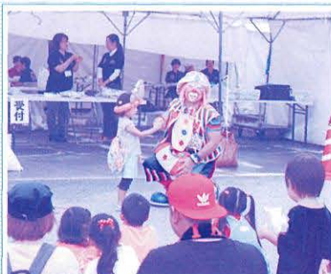
クラウンコトラパフォーマンス 子ども達に大人気! クラウンコトラのバルーンパフォーマンス