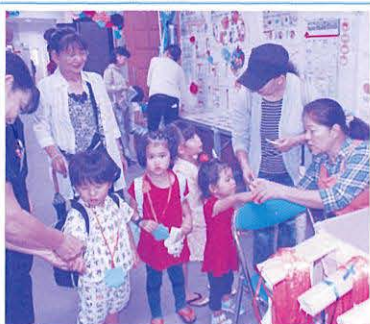
健康づくりコーナー 健康づくりのための情報がたくさん! 今回のテーマは「血管力」