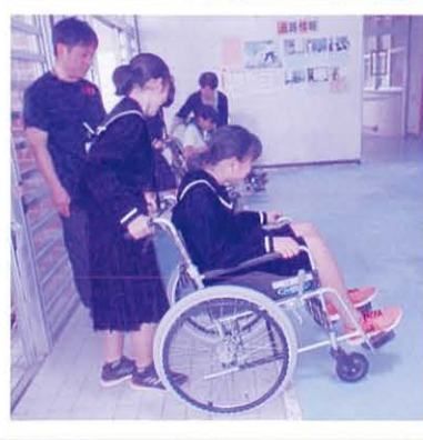
車いすでの段差介助体験