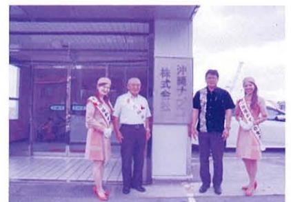
沖縄ナブコ 株式会社 様