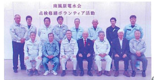
南風原電水会 有志の皆さん

地域の事業所の皆様が日頃の技術を活かして大活躍でした。活動に参加された南風原電水会の皆様、ありがとうございました。