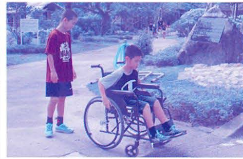
車いす体験(翔南小)

11月21日(水)に北丘小学校で講話「福祉つ てなに?」「ユニバーサルデザインについて」を行 いました。「赤い羽根共同募金」や「福祉まつり」 など身近にある福祉にスポットを当て、福祉とは 「みんなのため」ということを学びました。