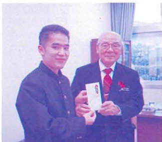
南風原町ジュニアリーダークラブ