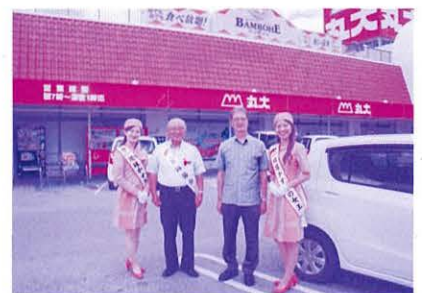
株式会社 丸大 様