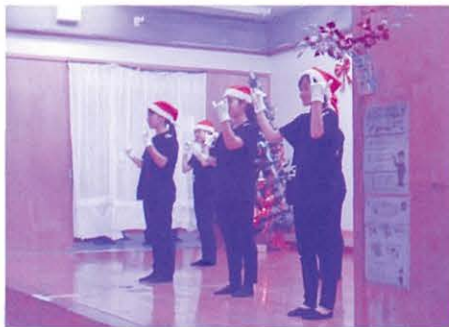
真和志高校手話部の生徒116日、町立本部児童館