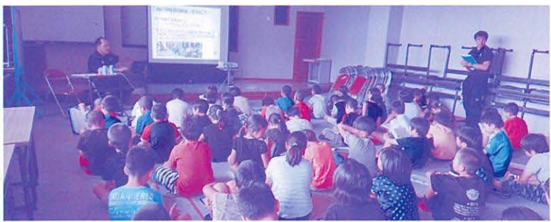
車いすの使い方の講話(翔南小)

生徒たちからは、「いつも歩いている校内の道でも車いすで通ると大変なところがいっぱいあった」と の意見が多く出るなど、車いすでの移動の際の感覚の違いに気づき「これからは困っている人がいれば 声をかけて手伝いたい」との感想が出ました。