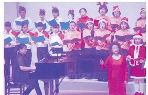
チャリティークリスマスコンサート