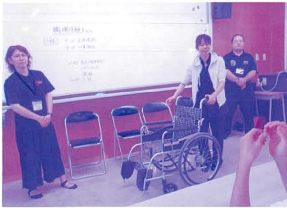
車いすの操作を説明する嬉の里職員

育て「自分に出来ることを探す」といったねらいのもと、 に関わる人々と連携を取り、様々な福祉学習を行っています。