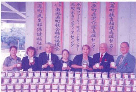
JA女性部による手づくり味噌の贈呈