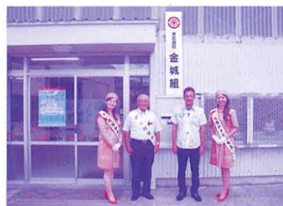
株式会社 金城組 様